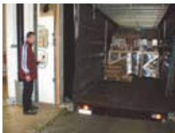
Automatyczne wyrównanie poziomu platformy

Automatyczne platformy (zamiast ręcznie regulowanych) umożliwiają odpowiednią regulację wysokości i łatwy dostęp do przyczep przy ich załadunku/rozładunku.