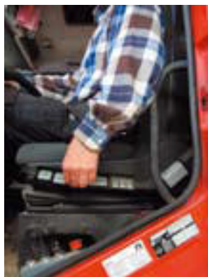
Właściwa regulacja siedzenia