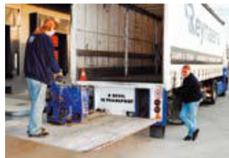
Wózek podnośnikowy z napędem elektrycznym