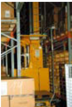
Zautomatyzowane hale magazynowe