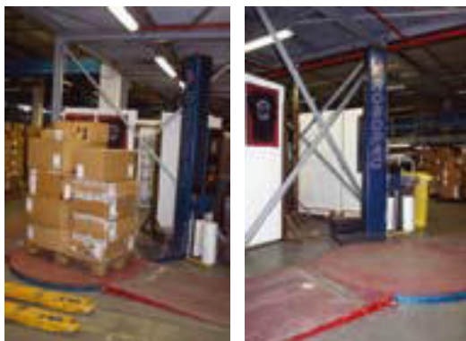
Urządzenie do automatycznego owijania folią termokurczliwą

Często pomocne w dostępie do ładunków może być proste przystosowanie istniejącego narzędzia lub skonstruowanie nowego. Na poniższych zdjęciach pokazano narzędzie zrobione przez kierowcę, ułatwiające dostęp do desek poziomych w przyczepie w przypadku, gdy należy je rozebrać.