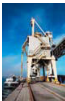
Zautomatyzowany załadunek ładunków masowych