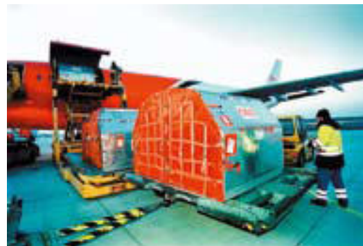
Automatyczny załadunek kontenerów ULD na pokład samolotu