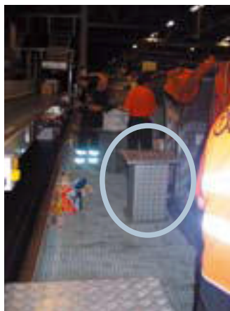
Podnoszenie z wykorzystaniem elementów podnoszących

Regulację wysokości można także wykonać za pomocą urządzenia podnoszącego lub (jak pokazano poniżej) elementów podnoszących ułatwiających chwytanie paczek wyjmowanych z ULD.