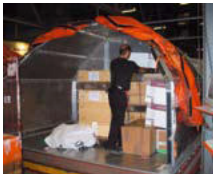
Grupowanie paczek w ULD

Grupowanie pakunków w pojedyncze kontenery typu ULD, przemieszczane następnie za pomocą urządzeń silnikowych, pozwala na uniknięcie jakiegokolwiek ręcznego przemieszczania ładunków.