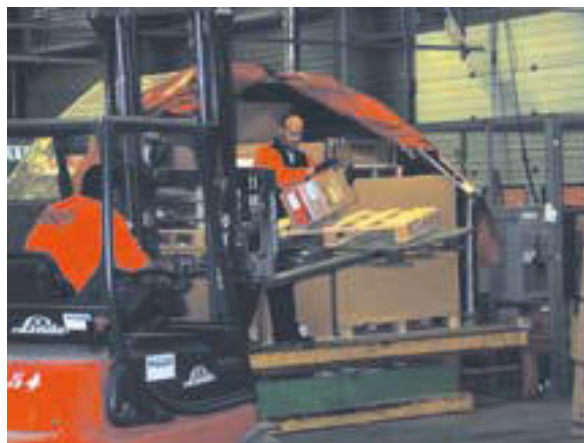
Podnoszenie wózkiem widłowym

Dopuszczalny ciężar zależy od odległości ładunku od ciała pracownika. Poniżej przedstawiono tabelę maksymalnych obciążeń, jakie można przenosić w zależności od wysokości ładunku i od odległości między ładunkiem a pracownikiem: