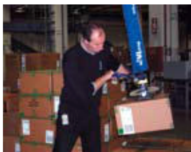
Urządzenie podnoszące działające na podciśnienie

Przykład: urządzenie ssące wykorzystuje system podciśnienia do podnoszenia i przenoszenia ładunków.