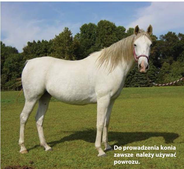
Do prowadzenia konia zawsze należy używać powrozu.

Aby uniknąć przydeptania przez konia podczas prowadzenia, należy iść na wysokości jego barku i dopasować swoje kroki do jego chodu.