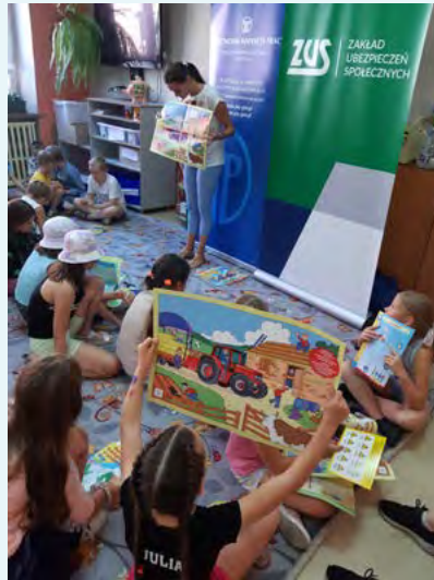
Photo. Educational event on the safety of children in villages, titled "Safe holidays", conducted by Opole District Labour Inspectorate

In the course of speeches for younger children, labour inspectors convey information about the potential hazards which may be faced by children on farms and they present