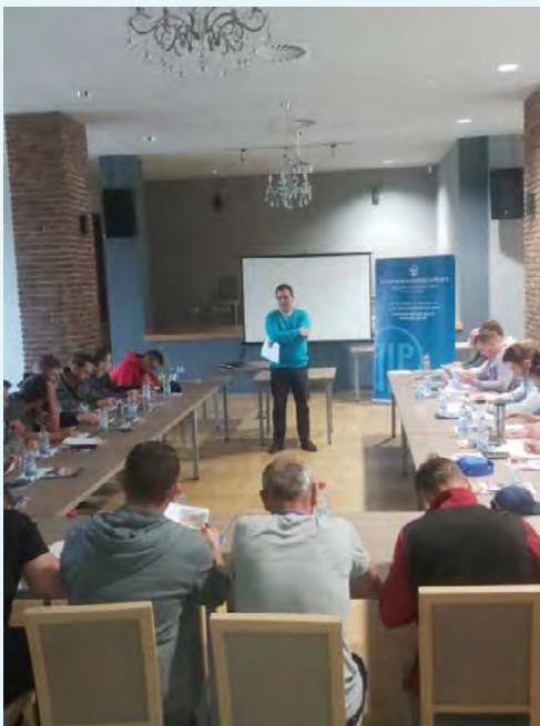
Photo. Training event for farmers in the Commune Centre in Mikołów, conducted by a specialist from Katowice District Labour Inspectorate

In its educational activities targeted at recipients from rural communities, the labour inspectorate takes advantage