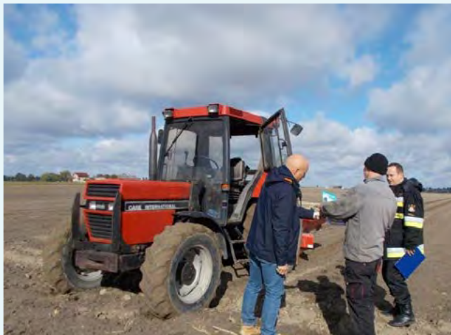
Photo. A specialist from Poznań District Labour Inspectorate during visitation to a place of field works.

the list of particularly hazardous tasks involved in running a farm, which may not be entrusted to children below 16 years of age. The talks are accompanied by games and plays during which the SLI's gadgets, publications and videos are used. They raise the children's awareness of mistakes made by their parents, and thus they have an impact on mutual interactions between a parent and a child, which many a time may protect both of them from an accident.