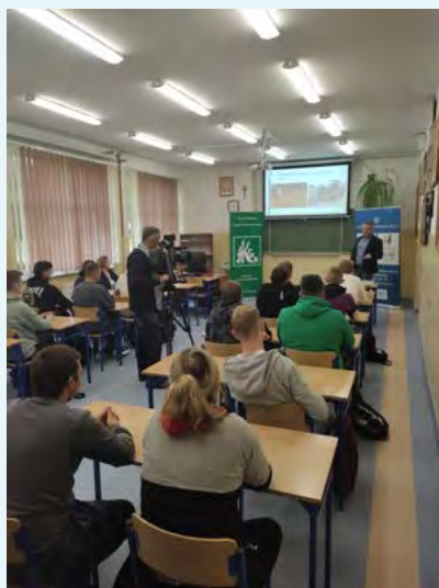
Photo. Training conducted by a specialist from Białystok District Labour Inspectorate in the School Complex in Niećkowo, with the participation of Białystok TV Station

Training actions of the State Labour Inspection have for years been supported by many institutional partners, such as the Agricultural Social Insurance Fund and farming advisory centres. Invaluable support also comes from social partners, among whom a significant role belongs to heads of villages and of communes, who readily