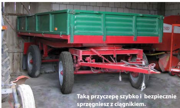
Taką przyczepę szybko i bezpiecznie sprzęgniesz z ciągnikiem.

Przyczepa powinna mieć zaczep podwieszony na sprężynach lub podpórkę ustawiającą zaczep na odpowiedniej wysokości. Zabezpiecz połączenie oryginalnym i dopasowanym bolcem z zawleczką. Podłącz hamulce i instalację elektryczną przyczepy do ciągnika. Po zakończeniu pracy podłóż pod koła przyczepy kliny zapobiegające jej przetaczaniu.