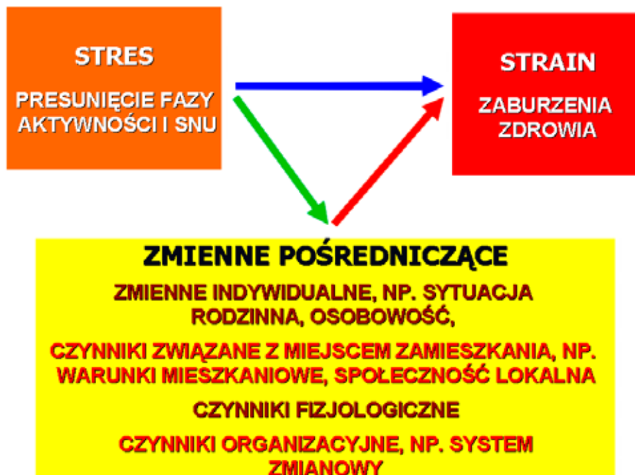
Rys. 3. Najprostszy model stresu pracy zmianowej

Na rysunku 3 został przedstawiony najprostszy model stresu pracy zmianowej zawierający tylko trzy elementy: obiektywny stres, subiektywny strain i zmienne pośredniczące (model Rutenfranza z 1976 r.).