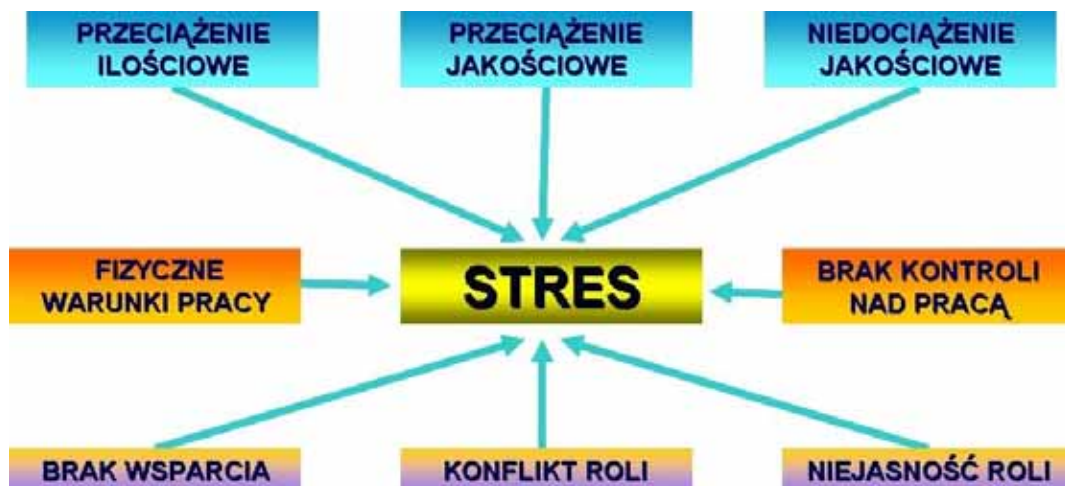
Rys. 2. Czynniki mogące wywoływać stres u pracowników.