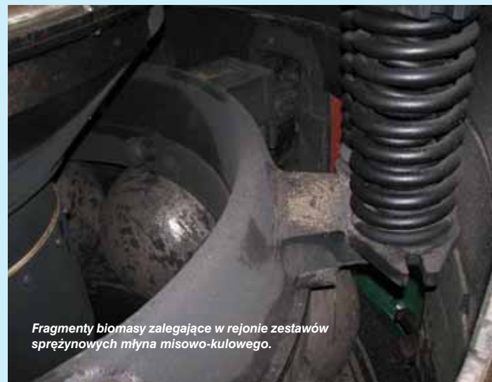
Fragmenty biomasy zalegające w rejonie zestawów sprężynowych młyna misowo-kulowego.

● w oparciu o warunki techniczne określone w Polskiej Normie PN-EN-05204:1994 „Ochrona przed elektrycznością statyczną – Ochrona obiektów, instalacji i urządzeń – Wymagania” należy zwrócić uwagę na ekwipotencjalizację