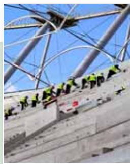
Okładka: fot. D. Korczak