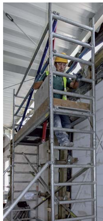
Podest z zamykanym włazem.