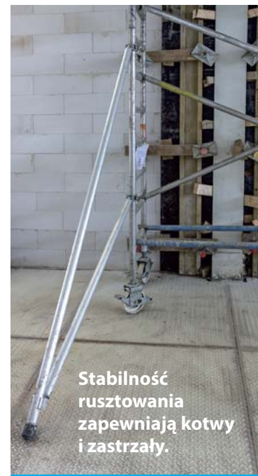
Stabilność rusztowania zapewniają kotwy i zastrzały.