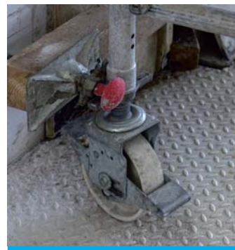
Hamulec rusztowania przejezdnego.